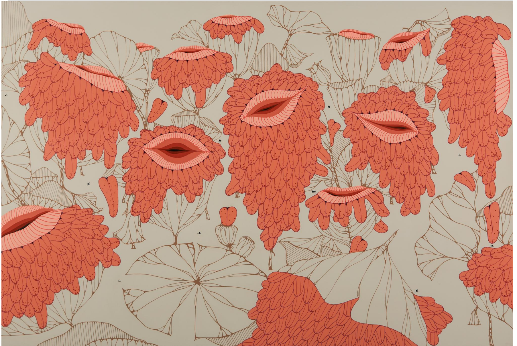
<Sneer>, acrylic on canvas, 130.3x193.9x3cm(세로x가로x깊이), 2021